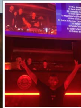
ProfsNight im „Park“