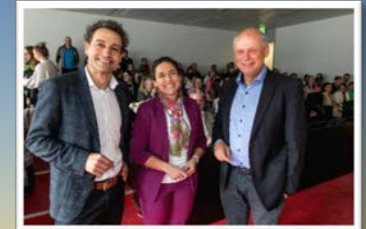
Führungskräfte-dialog mit CEOs