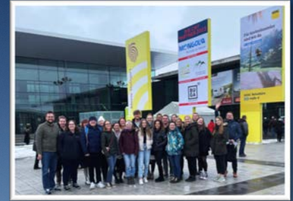
Exkursion zur CMT Stuttgart