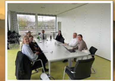
„Kamingspräch“ mit CEOs