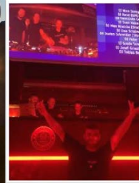
ProfsNight im „Park“