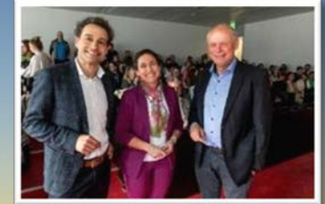
Führungskräfte-dialog mit CEOs