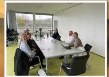
„Kamingespräch“ mit CEOs