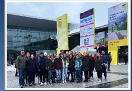
Exkursion zur CMT Stuttgart