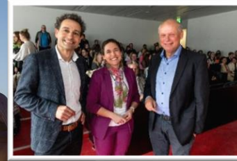
Führungskräfte-Dialog mit CEOs