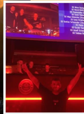
ProfsNight im „Park“