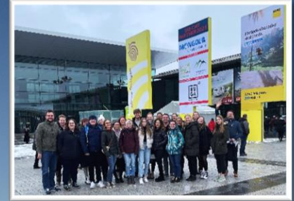
Exkursion zur CMT Stuttgart